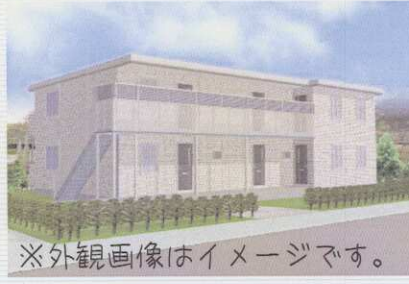
※外観画像はイメージです。

塗り替えの必要がない メンテナンス費を大幅に 軽減するタイル外壁。 お気軽にご来場ください。 無料お見積りなど、 ご相談承ります。