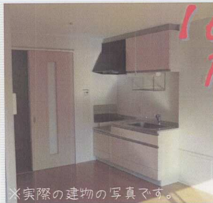
※実際の建物の写真です。