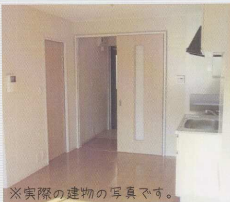
※実際の建物の写真です。